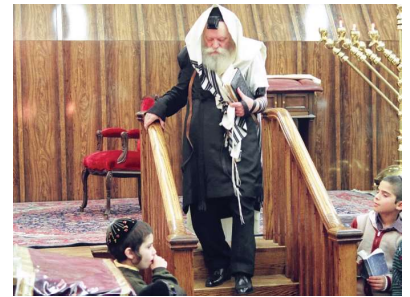
РЕБЕ ШЛИТА КОРОЛЬ МОШИАХ

Мы уже писали о переносе столицы из Москвы в Минск, хотя многим это было непонятно, так как на первый взгляд речь шла только о формальном акте. Но я предлагаю вспомнить использование французского гимна в качестве нигуна ХАБАДа. В результате этого президент Франции изменил ритм гимна, но через какое-то время вернул его обратно. Но дело было сделано и теперь мы можем