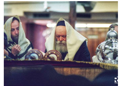
РЕБЕ ШЛИТА КОРОЛЬ МОШИАХ

Ребе ШЛИТА Король Мошиах учит нас, что в наше время, в эру Мошиаха все зависит только от самих евреев. Настоящим ответом на претензии «палестинцам» должно быть расформирование «Палестинской автономии» и однозначное заявление о том, что вся Земля Израиля полностью принадлежит исключительно еврейскому народу.