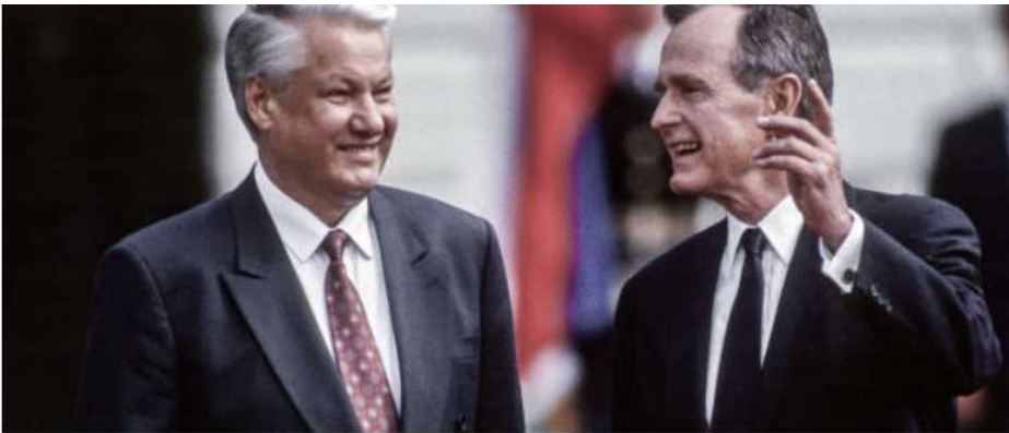
ДВА ПРЕЗИДЕНТА: ЕЛЬЦИН И БУШ В 1992 ГОДУ

По словам Любавичского Ребе Короля Мошиаха пик Настоящего и Полного Освобождения приходится на тот период истории, свидетелями которого мы являемся. Но заметны ли признаки продвижения мира к Полному Освобождению? С одной стороны, мы, хасиды Ребе, беззаветно верим в его слова, но, вместе с тем, должны знать и то, что согласно учению ХАБАДа, вера — это не только слепая вера, но и необходимость понимания человеческим разумом.