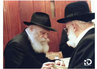
РЕБЕ ШЛИТА КОРОЛЬ МОШИАХ

то время Эстер была в опале и поэтому боялась идти к королю, но она понимала, что выбора у нее нет. В знак покаяния Эстер три дня постилась и призывала весь еврейский народ последовать ее примеру, а затем пошла к королю. В результате указ был аннулирован, Аман и все остальные враги еврейского народа были казнены, Мордехай был назначен королевским министром, а 14-й день месяца Адар был объявлен праздником Пурим.