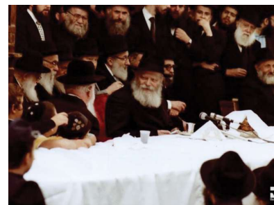
РЕБЕ ШЛИТА КОРОЛЬ МОШИАХ

Теперь становится понятным, почему слово «Освобождение» включает в себя слово «изгнание», но с дополнительной буквой «алеф». С помощью того, что мы раскрываем Всевышнего во всех аспектах окружающего нас мира, изгнание превращается в Освобождение. Освобождение — это раскрытие во всем истины Всевышнего.